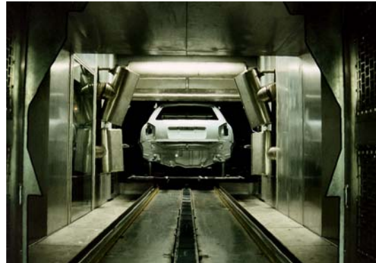
Ecopaint Blow-Off im Produktionseinsatz