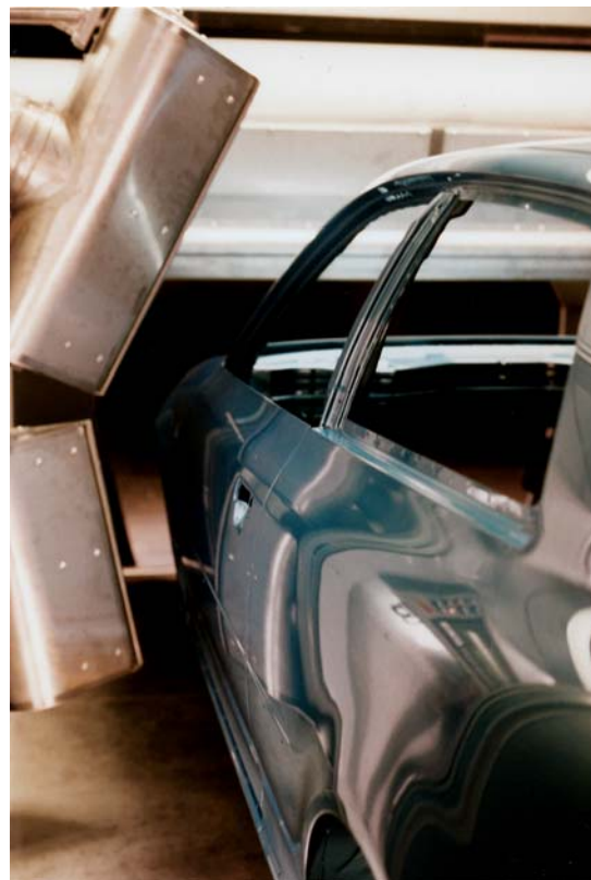
Düsen an der Seitenstation