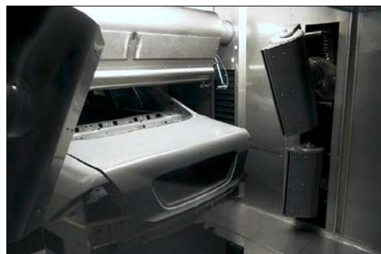
Düsen an der Seitenstation und Dachstation