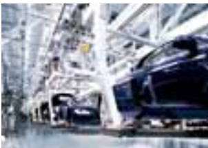
Mit FAS plant ® flexibel bauen.