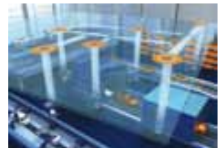
EcoEMOS – Produktions-Software.