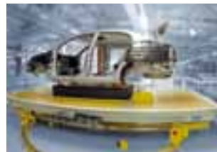
Besser unterwegs mit FAS floor .