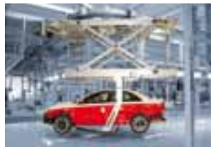
Alles hängt an FAS trolley .