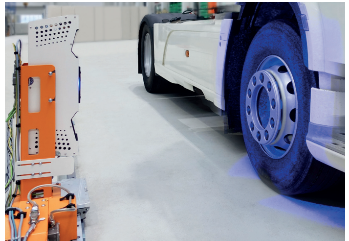
새로운 측정 센서인 x-3Dsurface를 갖춘 휠 정렬 스탠드 x-wheel truck d