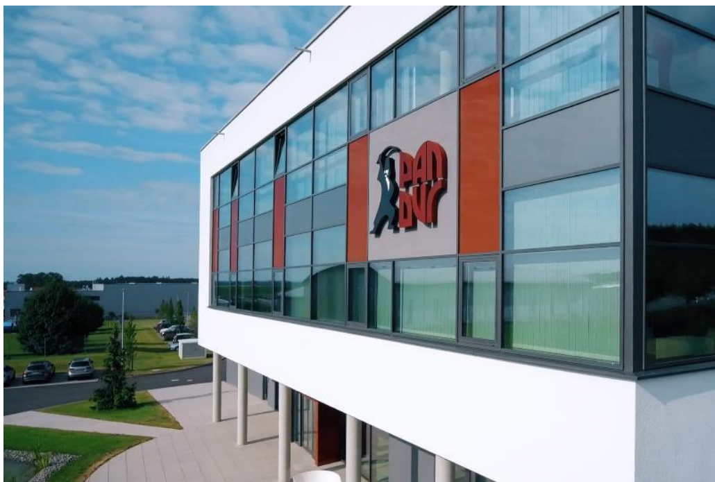
Ilustracja nr 1: Firma PAN-DUR produkuje szkło izolacyjne do komercyjnych urządzeń chłodniczych. Ostatnio firma zaczęła wykorzystywać do tego celu system EcoPaintJet firmy Dürr.